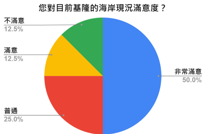
圖 2-2 活動滿意度調查圓餅圖