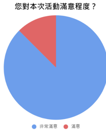
圖 2-1 活動滿意度調查圓餅圖