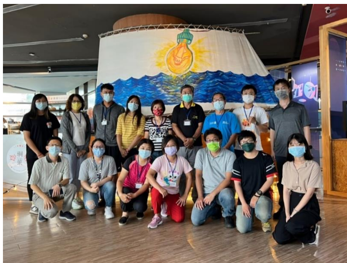
圖 1-3 大合照