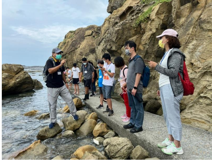
圖 1-1 大坪海岸導覽照片