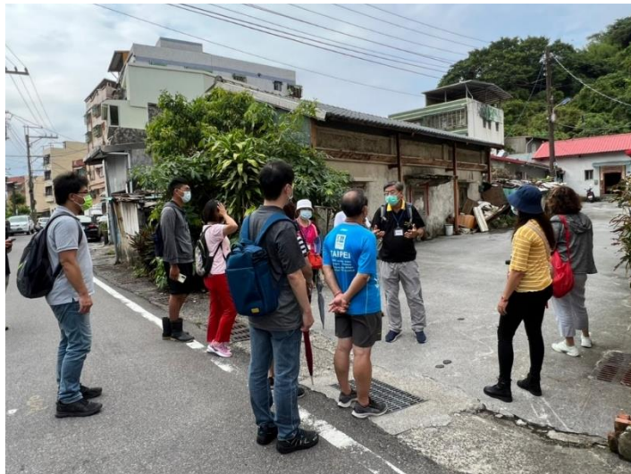
圖 1-2 漁村歷史文化導覽照片